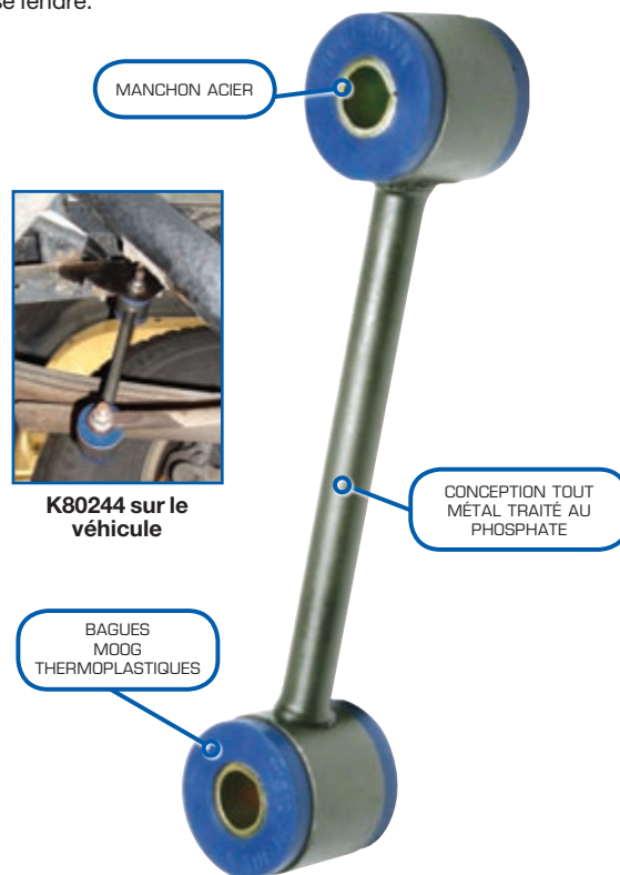
K80244 sur le véhicule